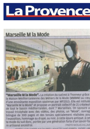
La Provence -4 Juillet