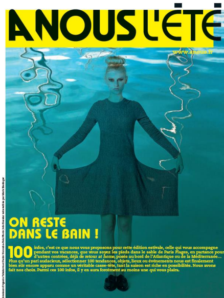
Couverture A NOUS L'ÉTÉ – Juillet-Août