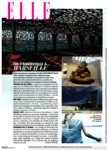
ELLE – 12 Juillet

France 2, TV5Monde, France 24, France Inter, France Culture, BFM Business.