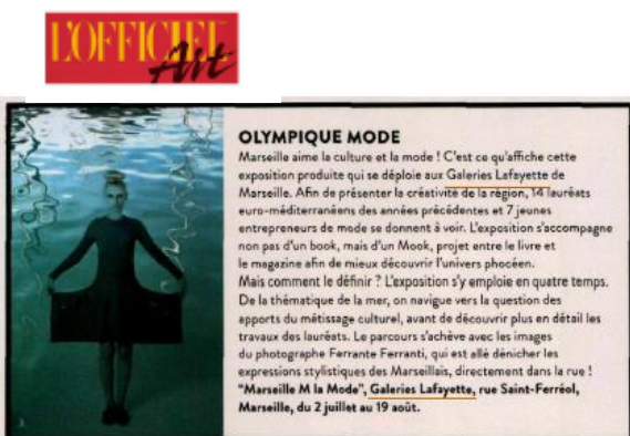
L'Officiel Art – Juin/Juliet/Août