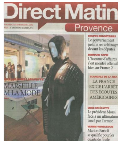
Couverture Direct Matin – 2 Juillet