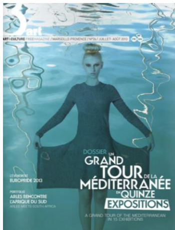
Couverture 8eme Art – Juillet/Août