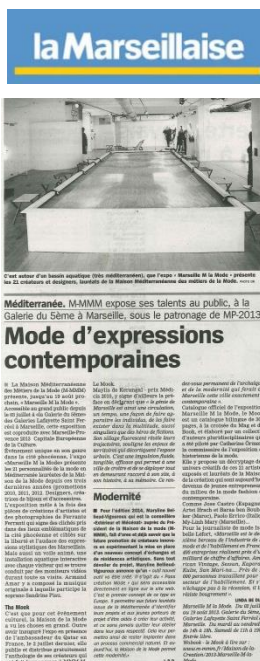
La Marseillaise – 13 Août